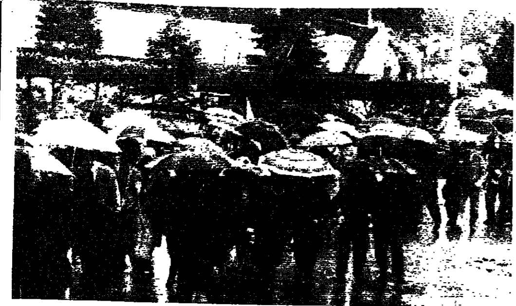
سيرات تحت المطر الى قصر جعجع (إشارة الشايب)